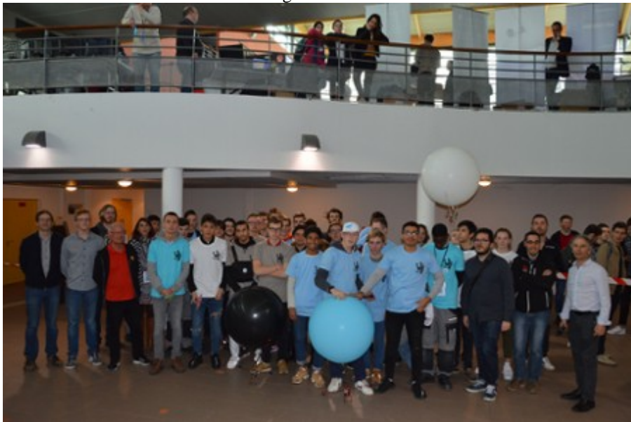
Photo finale de l'Hackathon