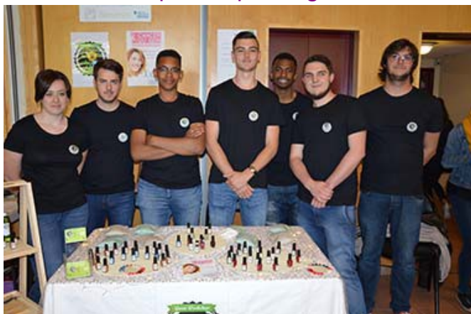
Mini-entreprise « Green Workshop »

L'action éducative « Envie d'entreprendre, envie de créer » portée par la Région en partenariat avec le Rectorat de l'académie de Nantes et la DRAAF propose aux jeunes des lycées, des CFA et des MFR de créer leur mini-entreprise - certaines d'entre elles sont constituées sous forme de SCOP - et de la faire vivre. La 12e édition a permis de découvrir des projets créatifs tournés vers une économie solidaire et participative.