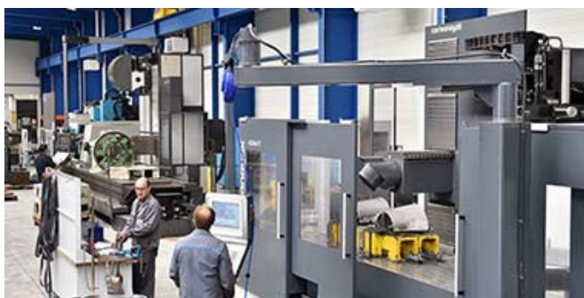
La Société Coopérative et Participative Delta Meca à Couëron, engagée dans l'ESS

L'Économie Sociale et Solidaire est définie par la Loi de 2014 comme un mode d'entreprendre caractérisé par une gouvernance démocratique, un but poursuivi autre que le seul partage des bénéfices et des principes de gestion (les bénéfices sont majoritairement consacrés à l'objectif de maintien ou de développement de l'activité de l'entreprise, les réserves obligatoires constituées, impartageables, ne peuvent être distribuées...).