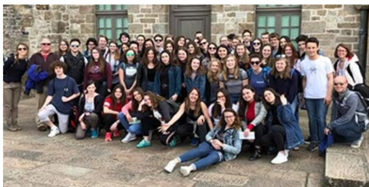
Mini-entreprise « Green Workshop »

Les échanges internationaux, encouragés par la loi d'orientation et de programmation pour la refondation de l'École de la République, permettent aux établissements de développer des partenariats entre pays et aux élèves de s'ouvrir au monde. Le lycée polyvalent Blaise-Pascal à Segré est engagé depuis plusieurs années dans cette dynamique.