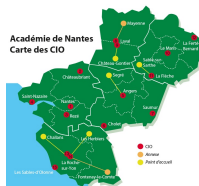
CIO de l'académie