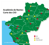
CIO de l'académie